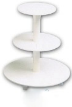
TS001 /CCS 005

Taartstandaard model 3 etages met gat door het midden, behalve de bovenste laag. Diameters: 34 cm - 24,5 cm - 19,5 cm. Ruimte tussen de plateaus 16 cm. Totale hoogte circa 35 cm. Ook te gebruiken voor cupcakes of boven op een taartje met op de overige lagen bijpassende cupcakes. Huur €5,00 voor 3 dagen. €9,00 voor een hele week. Borg 35,00