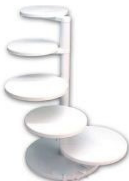
TS 003 Taartstandaard Budget. model 5 laagse trap standaard.

Taartstandaard model waterval breed en half rond voor 3 taarten. De Diameter van 28 cm geldt voor alle 3 de plateaus. Een 4 e taart kan eventueel op de tafel voor de standaard geplaatst worden. Huur €7,50 voor 3 dagen. €12,50 voor een hele week. Borg €45,00